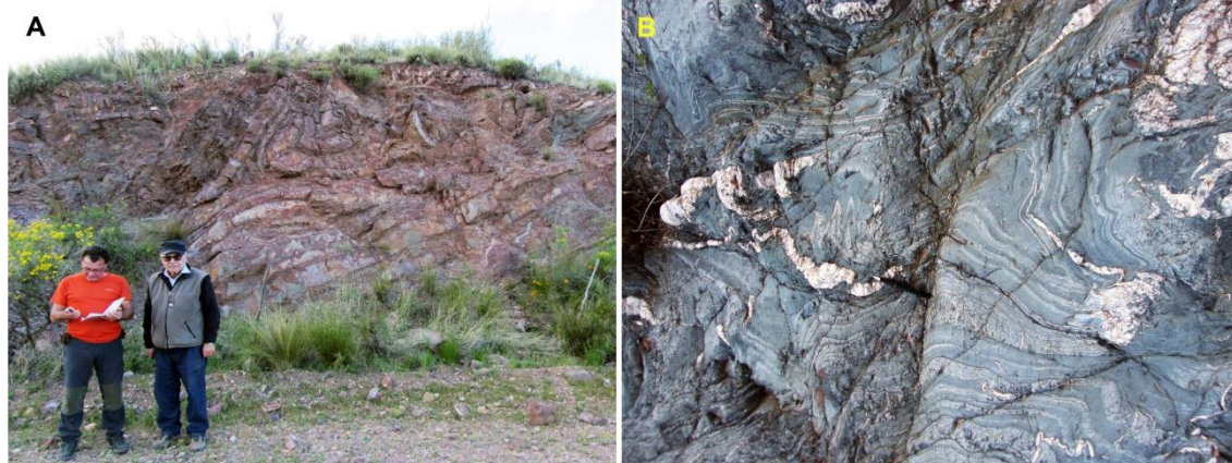
FIGURA 2. (A) Pliegues vergentes al este desarrollados en la Formación Pavón. (B) Interferencia de pliegues desarrollados en condiciones metamórficas de bajo grado en la Formación La Horqueta.

Desde el punto de vista de la estructura chánica, en el Bloque San Rafael se pueden distinguir dos dominios estructurales: (i) pliegues chánicos, desarrollados en ausencia de metamorfismo, que afectan a las formaciones paleozoicas situadas al este del Cabalgamiento de los Reyunos y (ii) estructuras chánicas desarrolladas en condiciones metamórficas de bajo grado que solamente afectan a la Formación la Horqueta y son observables al oeste del Cabalgamiento de los Reyunos.